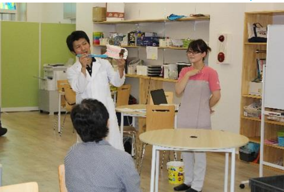
歯の磨き方の説明を教わりました

我々は皆さんの健口のために、全力で手助けをしていくつもりです。些細なことでも気になることは何でも申し付けください。