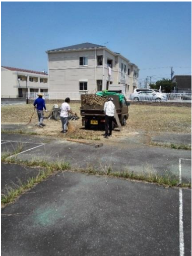
施設外就労で草取り後片付けの様子