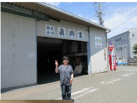
眞興業工場前ではいチーズ

Q 最後に、眞興業さんからメッセージなどありましたら、宜しくお願い致します。 A 委託した製品を一生懸命に行ってくれているので、これから入ってくる作業がある時には、是非お願いしたいと思っております。