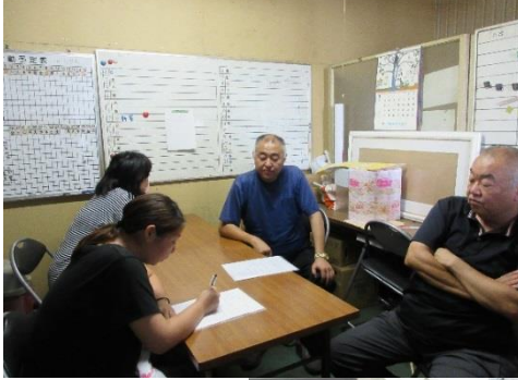
角谷様ご兄弟にインタビュー